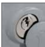
chiave di sblocco